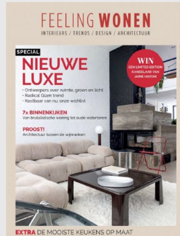
FEELING WONEN Idioma: Francés/ Flamenco 9 Números /año Difusión: 18.000 ejemplares Tarifa: 4.992 €