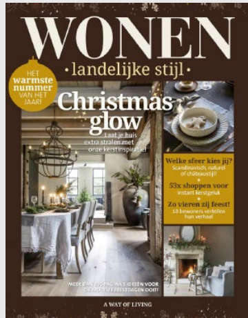
WONEN LANDELIJKE STIJL Idioma: Francés/ Flamenco 8 Números /año Audiencia: 170.000 lectores Difusión: 18.000 ejemplares Tarifa: 3.328 €