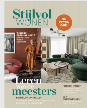
STIJLVOL WONEN Idioma: Flamenco 8 al año Audiencia: 126.000 lectores Distribución Bélgica: 14.000 Tarifa: 3.328€