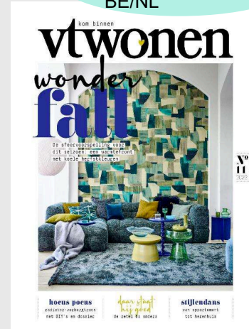
VT WONEN Idioma: Flamenco Mensual Audiencia: 571.000 lectores Difusión: 55.000 ejemplares. Tarifa: 5.890€ WEB en Bélgica: 616.000 uu