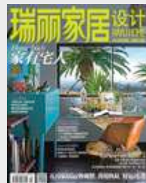
RAYLI JIA JU & Home and Deco

Mensual: Perfil : Business women 25-44 Difusión: 1.250.000 Tarifa: 35.700€ Tarifa : 280.000 RMB