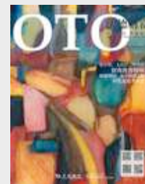
OTO (Bank of Communications)

Mensual: Difusión: 963.000 Tarifa: 22.100€ Tarifa : 173.250 RMB