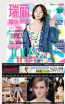
RAYLI FUSHI MEIRONG & Fashion and Beauty

Mensual: Perfil: Mujeres 20-30 Difusión: 1.380.000 Tarifa: 38.000€ Tarifa : 300.000 RMB